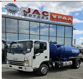
Автоцистерна для Тех. воды на шасси JAC N80. (2021г.в.)