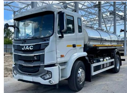
Автоцистерна для пищевых жидкостей (МОЛОКО) (АЦПТ-1,5, АЦПТ-5, АЦПТ-6, АЦПТ-10) на шасси JAC N35, N90, N120, N200

4x2, 2024 г.в. 130/152/166/245 л.с Дизельный, кондиционер, спальник. Опции: дополнительные секции, промывка цистерны, насос